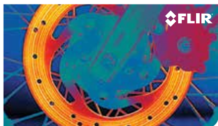
Essai de freins de motocyclette